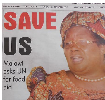
President vraagt om voedselhulp