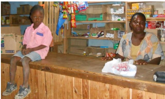
Lokaal winkeltje in Dedza zonder klanten

Op dit moment is het regenseizoen in Malawi en de mensen op het platteland hebben het moeilijk. De prijzen voor brandstof en voedsel zijn schrikbarend hoog en de boeren kunnen amper zaden en kunstmest kopen om de broodnodige maïs te planten. In januari gingen de Malawiërs in Lilongwe de straat op om te demonstreren vooral om mevrouw de president te bewegen iets te doen aan de devaluatie van de Kwacha en de (te) hoge prijzen.