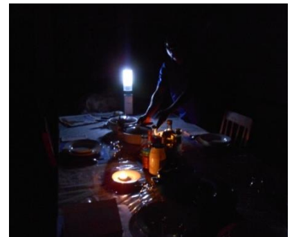
Dedza, er is opnieuw stroomstoring